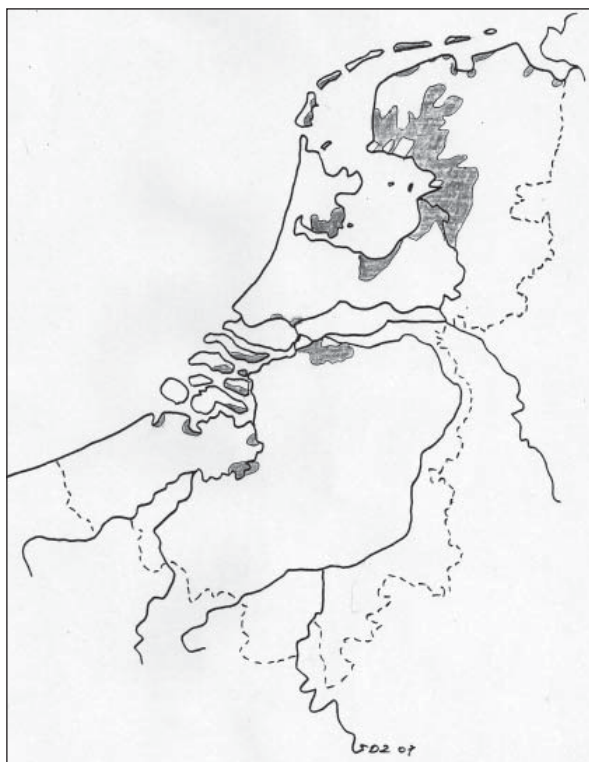
1. De in 1825 geïnundeerde gebieden (kaart door de auteur).

Bloedwonder, en het apocriefe verhaal van de Kat van de Kinderdijk, dat pas een eeuw later werd opgetekend. De internationale evergreen over de strijd van de Hollanders tegen het water, Hansje Brinker die het land redde door zijn vinger in het gat in de dijk te steken, is verzonden door de Amerikaanse schrijfster Mary Mapes Dodge in 1865 – al heeft de waterbouwkundige Andries Vierlingh een enigszins vergelijkbaar geval beschreven, dat zich na de Sint-Felixvloed van 1530 op Walcheren heeft voorgedaan. Maar het veronderstelde ‘mirakel van Munnekeburen’ is het dankzij het kritische onderzoek van Siderius en de zijnen niet gegund om te worden toegelaten tot de reeks van wonderbaarlijke reddingen.