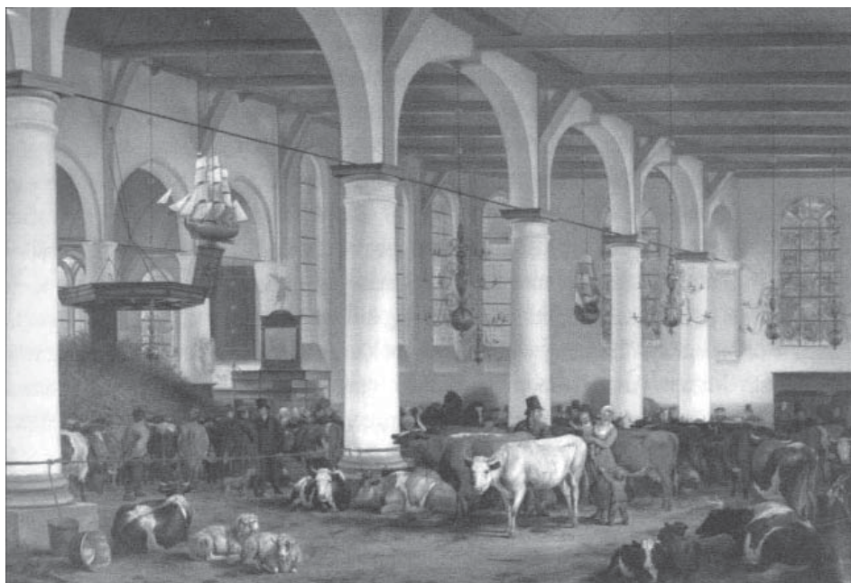
2. Het vee in de kerk van Oostzaandam tijdens de watersnood van 1825, schilderij van James de Rijk (1830) (uit: J. ter Pelkwijk, Overijssels Watersnood. Een heruitgave van het verslag van de ramp van 1825 (Kampen 2002), p. xiii).

Koninkrijk der Nederlanden, zullende worden gehouden te Groningen op den 20 juni 1825 ingevolge programma van den 2 mei bevorens.’